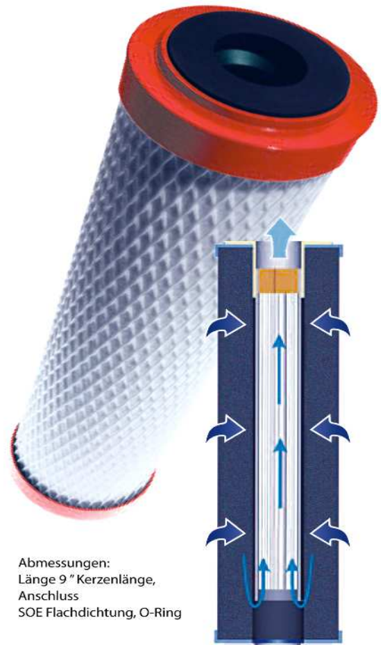
Abmessungen: Länge 9" Kerzenlänge, Anschluss SOE Flachdichtung, O-Ring

Temperatur: Einsatz nur bei Kaltwasser, vor Frost schützen.